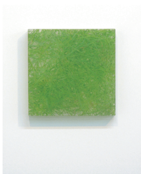
Photo painting 「叢06-10.12」 ポリエステル樹脂パネルに油彩・ミクストメディア 22.6×22.6cm 2006（参考図版）

川井昭夫は独学で現代美術の世界で活躍する数少ない作家であり、長年にわたり富山市にアトリエを構え独自の発表を重ねています。昨年には岐阜美濃加茂市民ミュージアムにて回顧的な展示と新作展示による大規模な展覧会を開催し、精力的に制作をし続けております。今回は長年制作してきた二つのタイプの絵画作品をあえて並列することにより川井の制作コンセプトを更に明確にする展示になるでしょう。また、初日には参加者とのフリートーク形式によるギャラリートークを開催いたします。