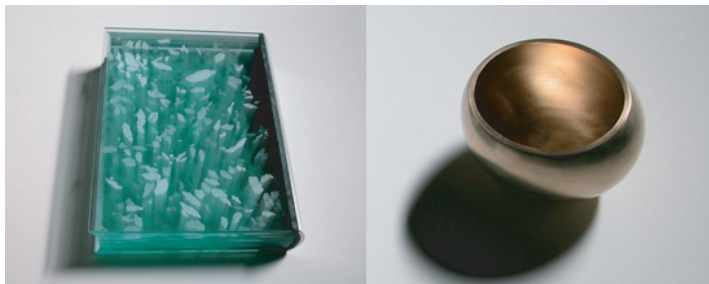
福嶋敬恭 Title: "PRIME NUMBER SPACE VOICE 2010" Glass Book 270 x 210 x 55 mm 2010 ガラス Auminum Bronze 115 x 140 x 100 mm bronze, Wooden Stick