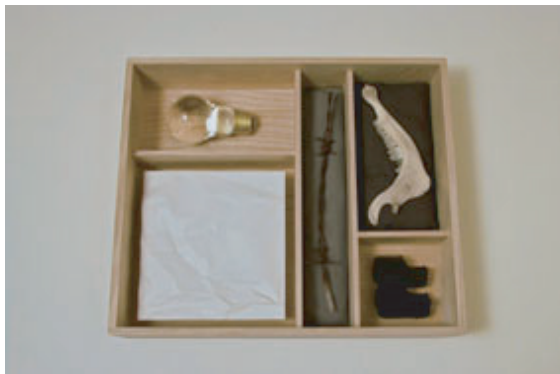
大西伸明 Title : In Praise of Shadows 樹脂に彩色 34×28.5×8cm 2010