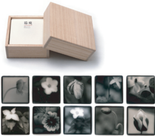
日下部一司 Title: 箱庭 Size: 140×135×53mm ゼラチンシルバープリント 2010